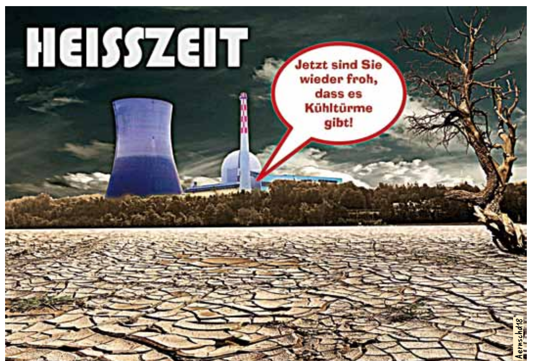
Cartoon Aernschd Born