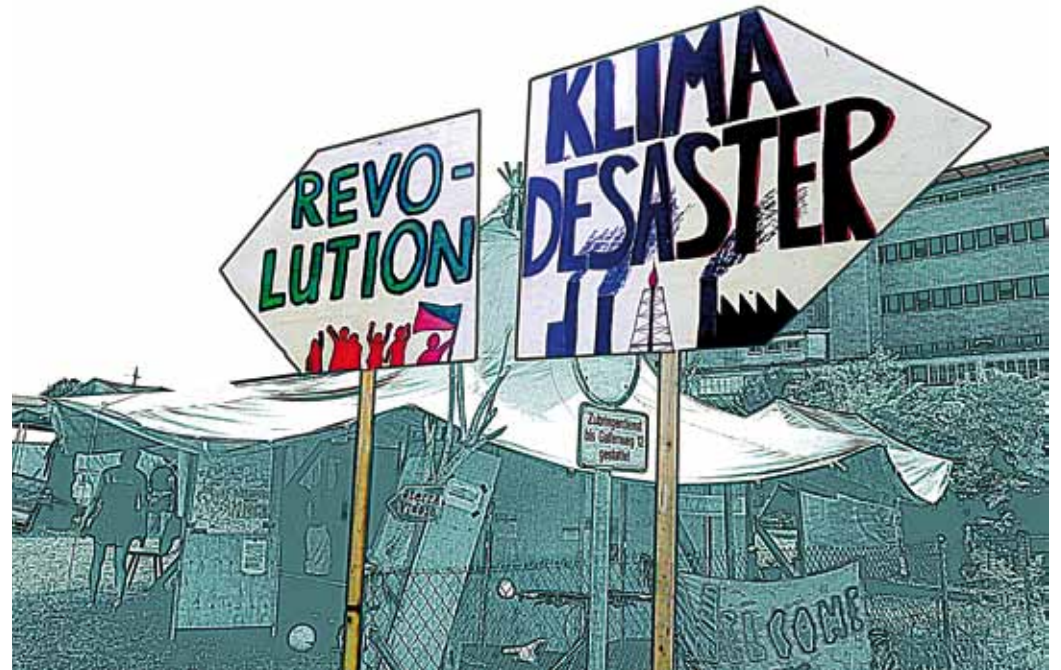
Revolution oder Klima-Desaster - laut Klimacamp zwei alternativlose Alternativen.

https://www.climategames.ch/klimacamp https://youtu.be/d4ZyYBoR2TQ