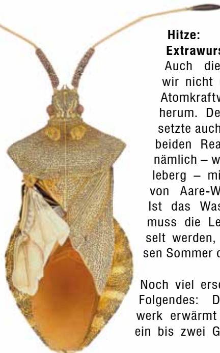
Eine Wanze mit verkrüppeltem Flügel aus dem Umfeld eines Schweizer Atomkraftwerks. Kein Grund zur Beunruhigung?! (c) Cornelia Hesse-Honegger.

Im Anschluss hielt Cornelia Hesse-Honegger einen Vortrag über «Die Macht der schwachen Strahlung». Die naturwissenschaftliche Zeichnerin dokumentierte die Folgen der Super-Gaus von Tschernobyl und Fukushima für Insekten vor Ort, aber auch in weit entfernten Gebieten, wo es durch Regen zu radioaktivem Fallout kam, z.B. in der Südschweiz. Die Zeichnungen der durch Mutationen missgebildeten Tierchen waren belegend. Noch beunruhigender ist aber, dass solche Mutationen auch im Umfeld von «normal» laufenden Atomkraftwerken vorkommen. Umso dringlicher erscheint es deshalb, diesem Unfug ein für alle Mal ein Ende zu bereiten.