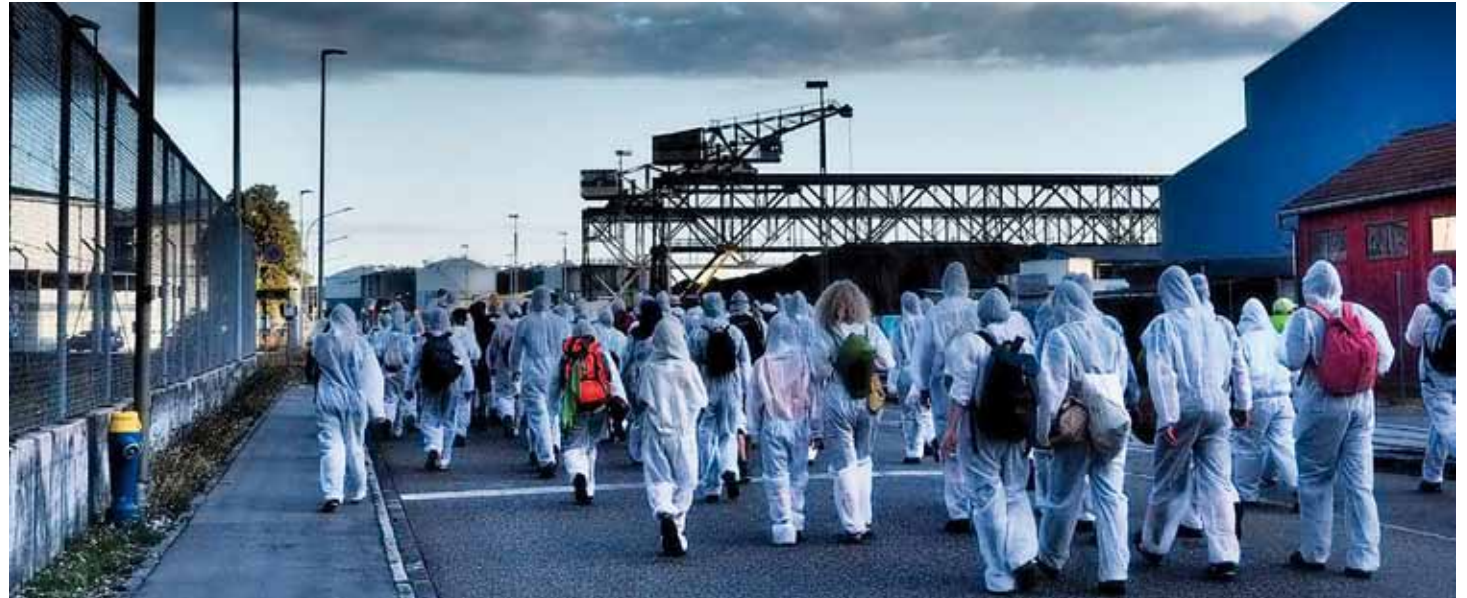
Vom 3. bis 13. August 2018 fand in Pratteln bei Basel das Klimacamp statt, tatkräftig unterstützt von NWA. An den Aktionstagen 10. und 11. August wurde in gewaltfreien Aktionen unter anderem der Basler Ölhafen blockiert, um auf die Rolle des Öls angesichts der drohenden Umweltkatastrophe hinzuweisen.